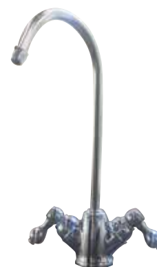
Rubinetto a 2 vie in dotazione